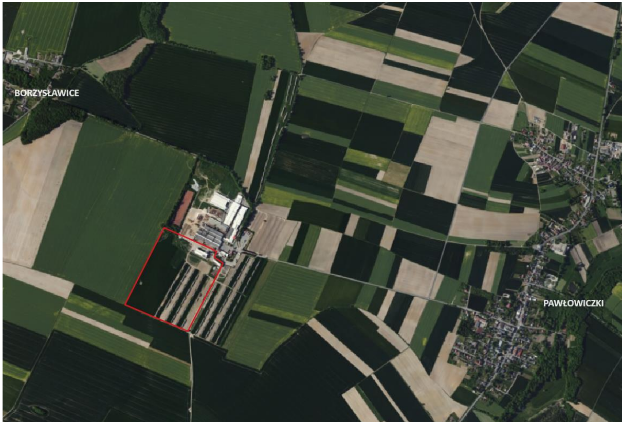
Rysunek 1. Obszar objęty planem na zdjęciu satelitarnym

Na poniższym rysunku przedstawiono obszar objęty planem.